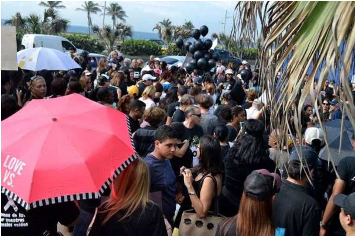
...schwarzgekleidet und mit schwarzen Luftballons...