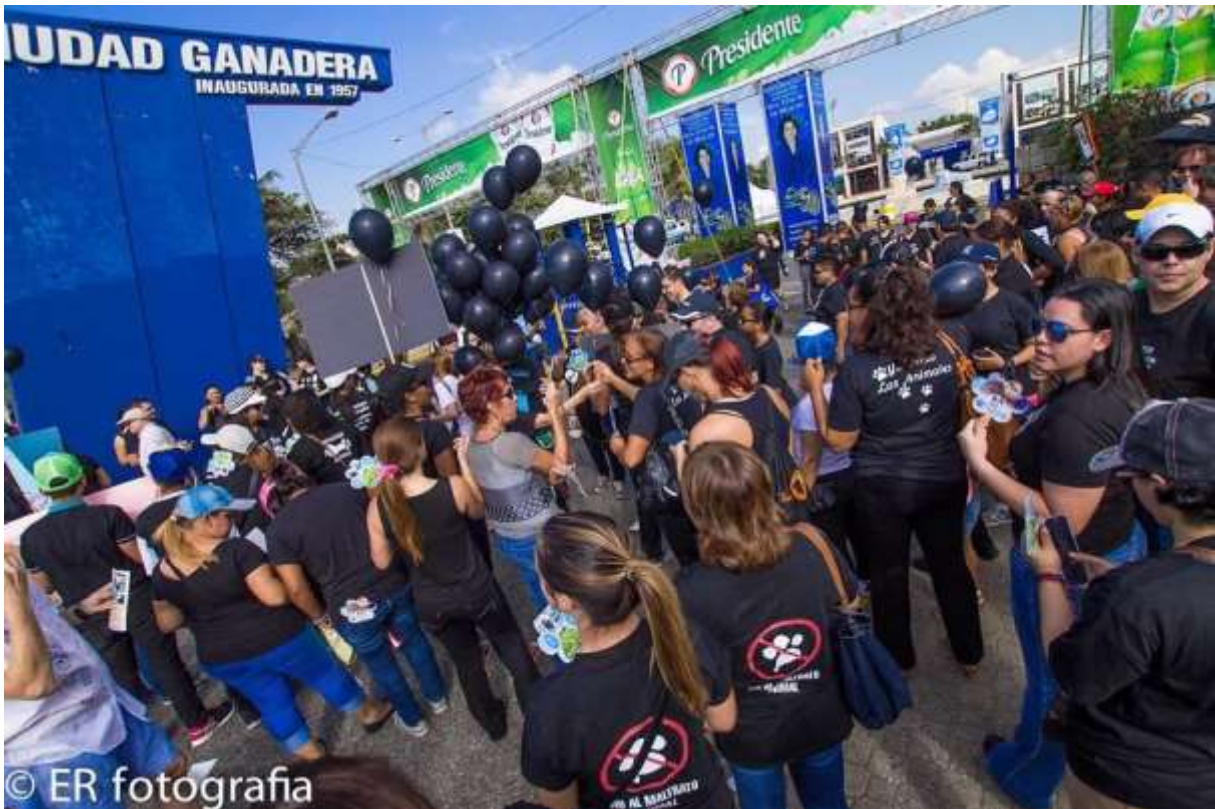
... die sich zum Eingang der Feria Ganadera drängten.