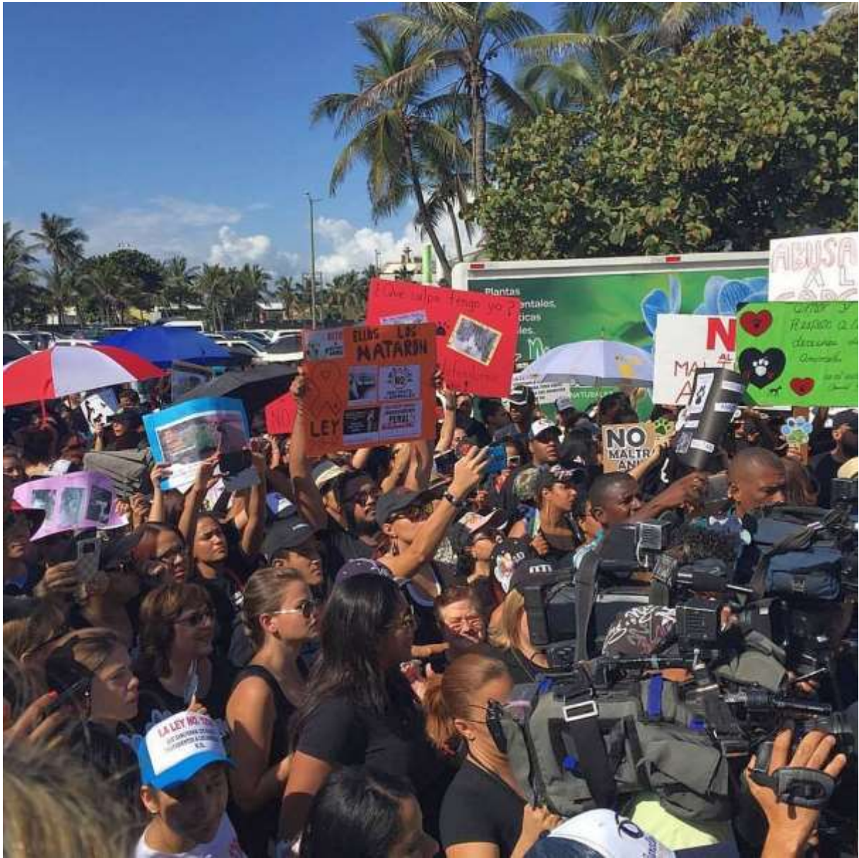
...und der Presse...