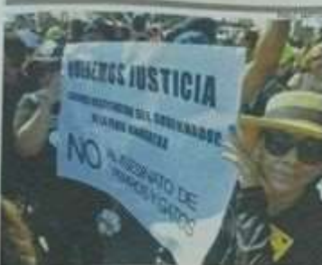
Defensores de animales ocupan Feria Ganadera por nuevos casos.