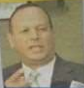
CONTAMINACIÓN POR BACTERIA VIBRIO CHOLERAE

Tratamiento. De los 46 afectados, 11 son detenidos en el Hospital de La Victoria y el resto es tratado en el país.