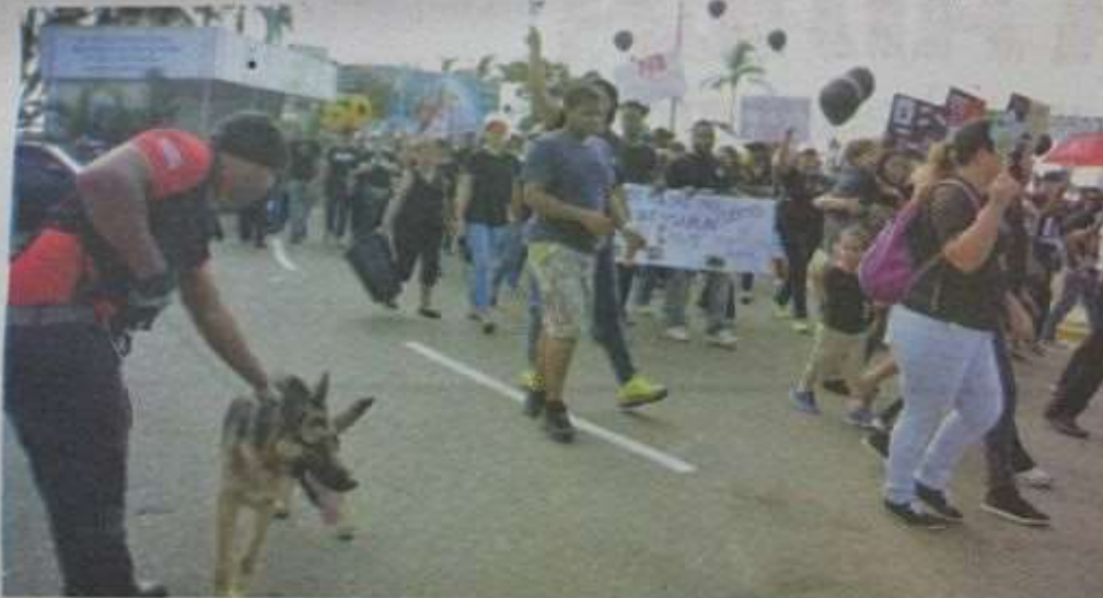
Apoyo. Decenas de manifestantes reclamaron ayer respeto por los animales durante una marcha realizada en las inmediaciones de la Feria Ganadera.