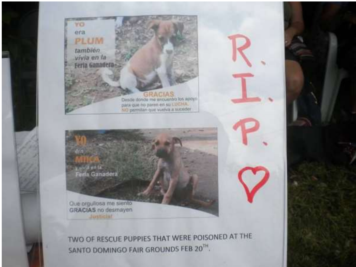
Unter den Opfern auch die Welpen Plum und Mika.