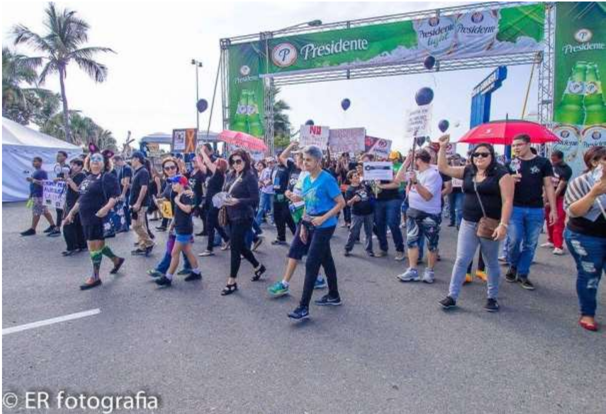
Einmarsch in die Ganadera...