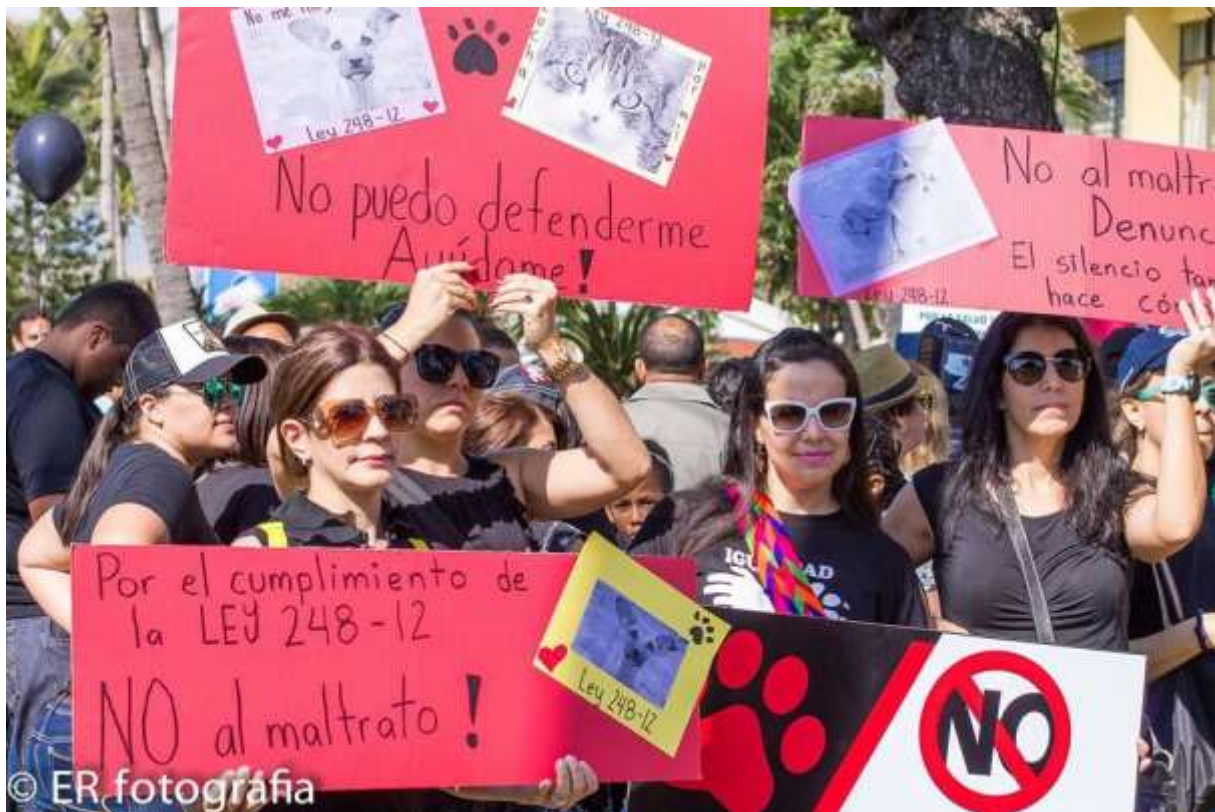
Und immer wieder die Forderung der Durchsetzung des Ley 248-12, des dominikanischen Tierschutzgesetzes...