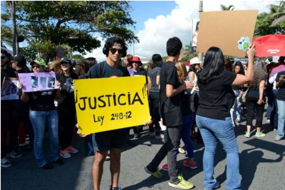
... das Vergiftungen unter hohe Strafen stellt.