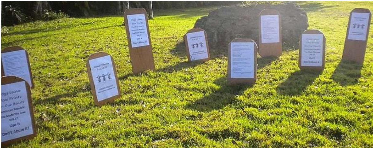
Unsere Freunde von der A.A.A.S. und Moringa's Mission hatten einen Plakatwald gepflanzt.