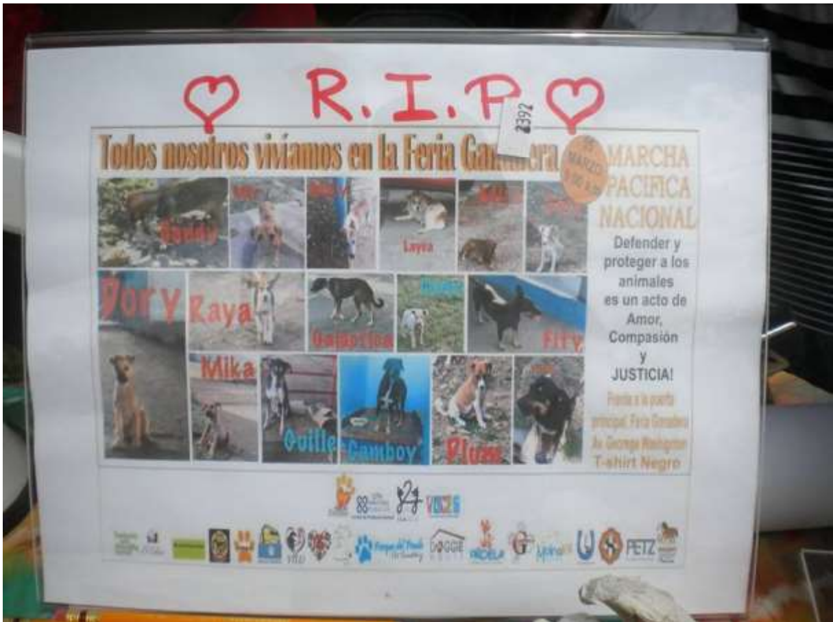
...und Todesanzeigen. R.I.P. – Rest In Peace! Ruhet in Frieden!