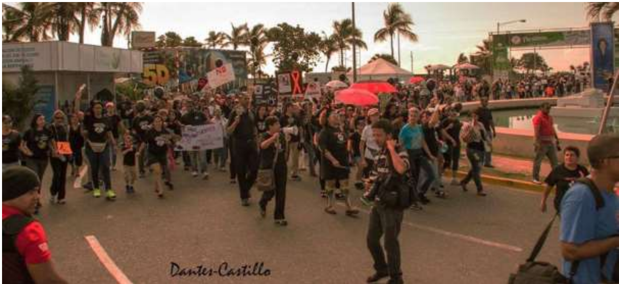
begleitet von professionellen Fotografen wie ER fotografia und Dantes Castillo...