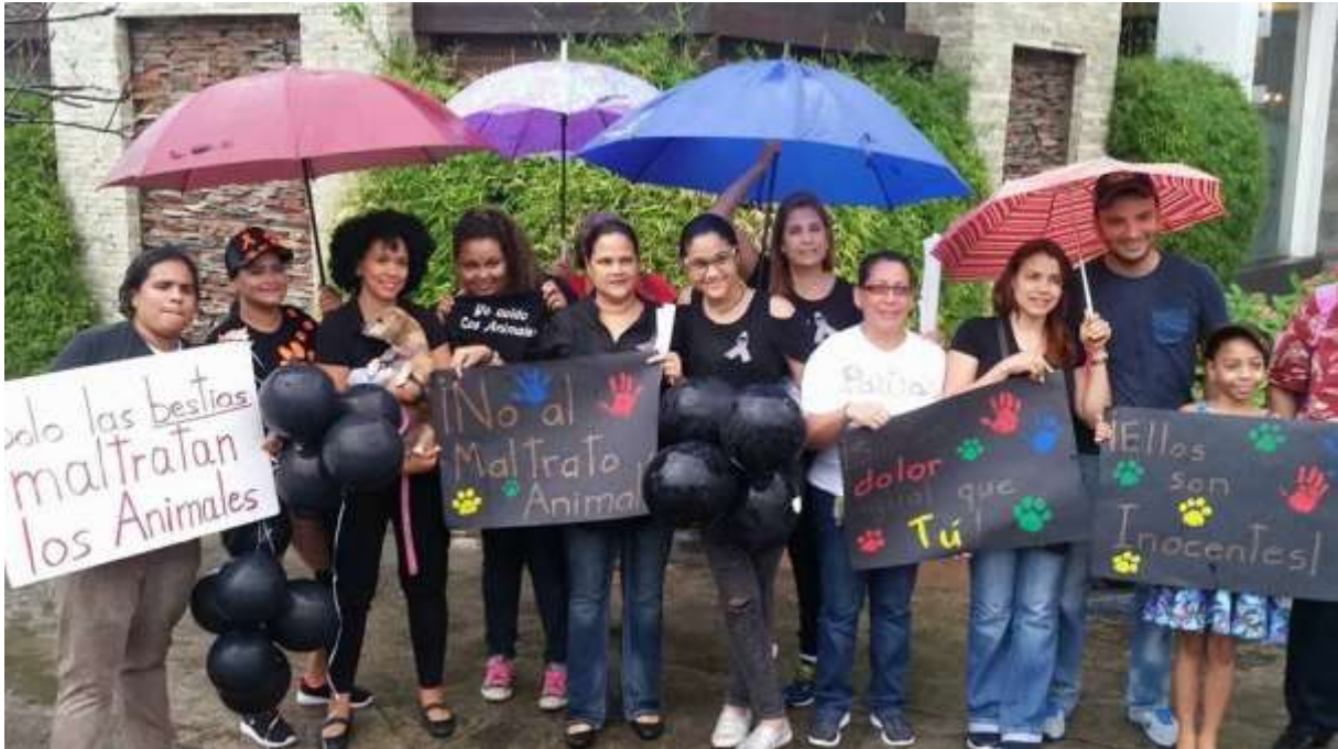
Santiago am 05. 03. 2016

Gleichzeitig fanden Solidaritätsveranstaltungen in anderen Teilen der Dominikanischen Republik statt: