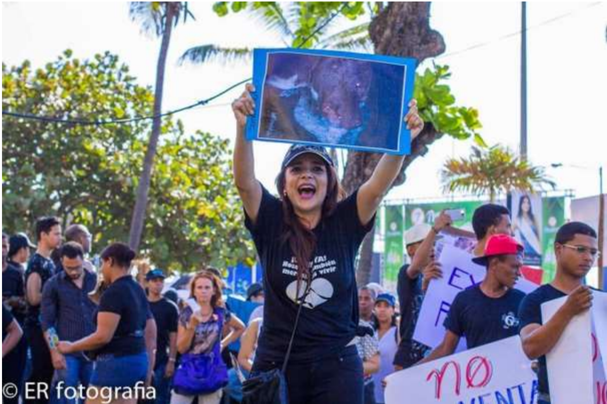
... Fotos der vergifteten Hunde...