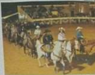
Desfile con la Feria al Ovalo Central de la Ciudad Ganadera