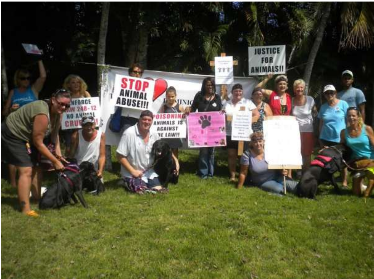
Sosúa-Cabarete am 05. 03. 2016