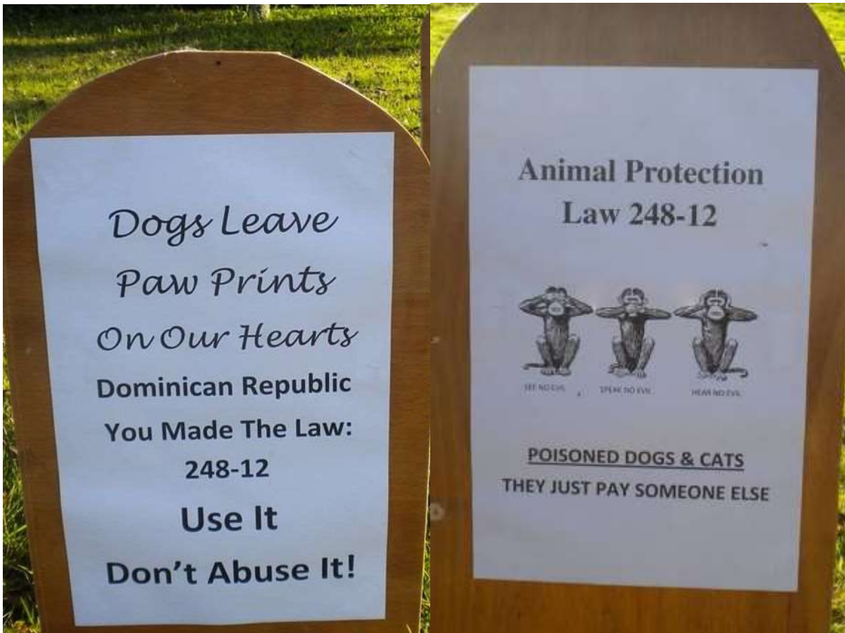
Und auch hier überall dieselbe Forderung nach der Durchsetzung des Gesetzes 248-12!